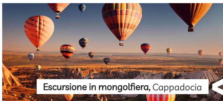
Escursione in mongolfiera, Cappadocia

Istanbul sarà la prima e ultima tappa di questo viaggio: la metropoli tra Asia e Europa dove forte si sente e si vede l'eredità bizantina e ottomana. Il vostro viaggio proseguirà poi verso l' Anatolia . Passando per Ankara , la Capitale, approderete in Cappadocia , un luogo fatato che sembra uscito da un libro di favole incantate: vallate costellate di alti pinnacoli rocciosi dalla storia millenaria, i famosi "camini delle fate". Un viaggio incredibile che rimarrà indelebile nei vostri cuori!